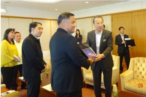
メトロセブ研修団が神戸市岡口副市長を表敬訪問、 マンダウエ副市長から都市間交流・技術協力の熱い要請