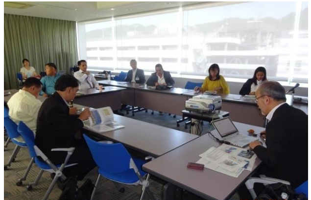
窓から山の緑が望める環境はメトロセブと同じ。市税を使 わない公営企業会計の都市開発手法に関心が集まる