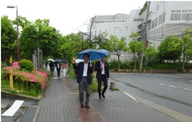
都心から地下鉄で 20 分ほど、駅に直結する産業団地の 緑豊かな環境と雨でも快適に歩けるインフラ整備シナリオ