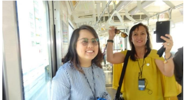
都心と空港を結び、産業や大学ゾーンへのアクセス・サー ビス、女性にとっても明るく快適な新交通は満足度が高い