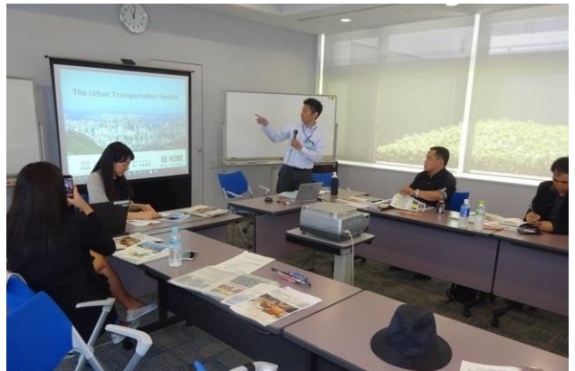
地形の類似性から、都心のあり方、公共交通の連結・結 節点に関する課題は同じ、将来の都心を見つめる