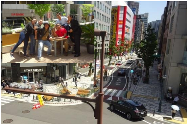
将来の都心空間、快適な歩行者空間は、東南アジア新 興国の都市計画者にとり、刺激的であり、新たな観念