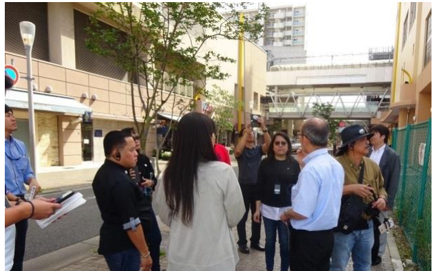
法制度が不足するため、用地買収以外に道路拡幅手段 のないフィリピン、再開発や土地区画整理は関心の的