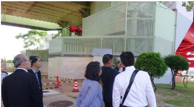
新ターミナルも整備され年間搭乗者 1 千万人を超える国 際空港、悲願の軌道系公共交通の導入への視線は鋭い