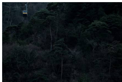
黒木治代 様 「去りゆく郷愁のロープウェー」 「令和2年1月、ある冬の日」