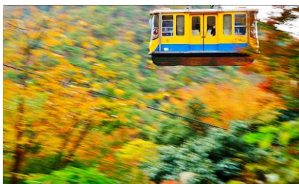
栗原正隆 様 「彩りの季節、流れゆく」